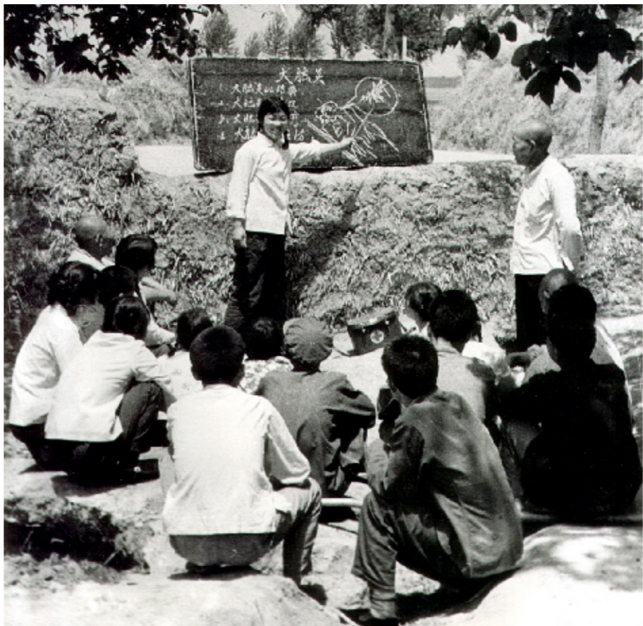
20世纪80年代防疫人员在田间地头宣传疾病防治知识

一次次的出色表现让人们看到了一个战斗在与公共卫生一线的“英雄团队”。在2013年河南省卫生厅组织开展的全省卫生应急大比武和全省疾控机构岗位练兵比武活动中,许昌市疾病预防控制中心分别获得了全省卫生应急比武团体二等奖(总分全省第二名)、全省疾控机构岗位比武团体三等奖(总分全省第五名)的好成绩。同时,许昌市参赛队员分别获得个人特等奖及一、二、三等奖的好成绩。