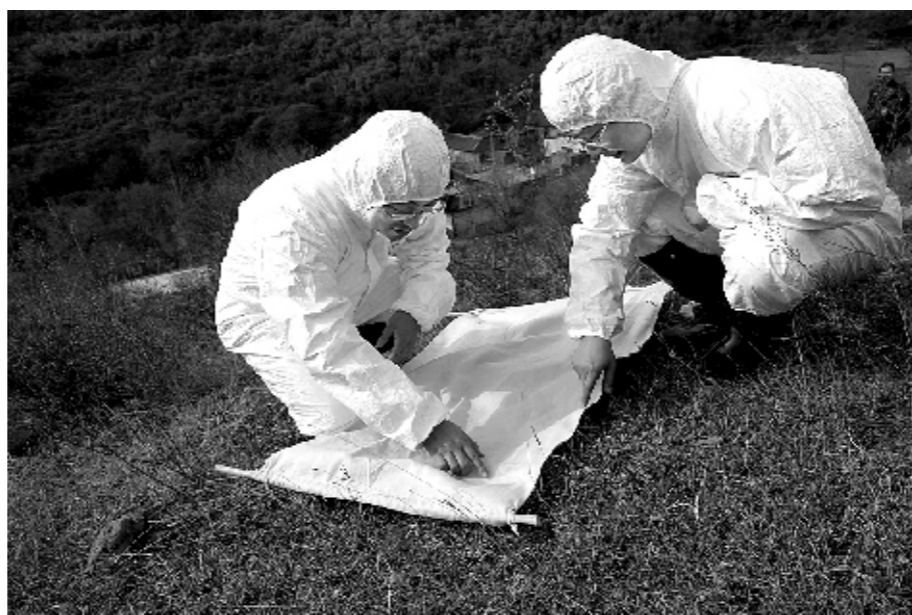
疾控人员在山区调查蚊虫种类及其分布情况